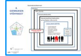
4. OJENNUKSEN VYÖHYKKEET