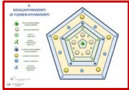
KOULUHYVINVOINTI JA YLEINEN HYVINVOINTI