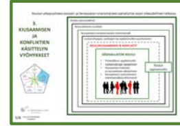
3. KUSAAMISEN JA KONFLIKTIEN KÄSITTELYN VYÖHYKKEET