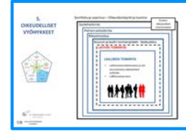
5. OIKEUDELLISET VYÖHYKKEET